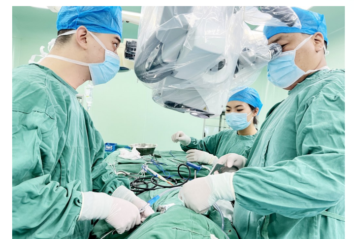
神经外科手术进行中