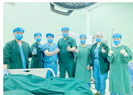
优秀的神经外科手术团队