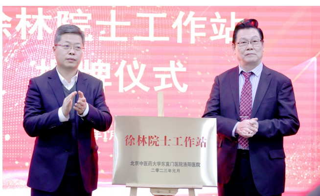
徐林院士工作站揭牌

4月8日，李佃贵国医大师毒理理论临床研究中心在北京中医药大学东直门医院洛阳医院(洛阳市中医院)揭牌，这是继徐林院士工作站、王永炎院士传承工作室在该院揭牌之后的又一重大盛事。3位国家级中医药名家在洛阳设立“基地、工作室、工作站”，意义非凡，不仅成为北京中医药大学东直门医院洛阳医院(洛阳市中医院)对标一流、抢抓机遇、打造区域中医医疗高地与人才培养基地的标志，还是以此为契机，留下一支带不走的团队，让优质中医药资源在洛阳扎下根来。