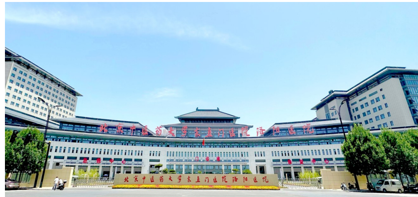
北京中医药大学东直门医院洛阳医院(洛阳市中医院)外景