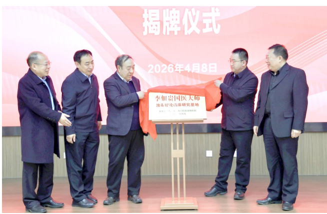
李佃贵国医大师毒理理论临床研究中心揭牌