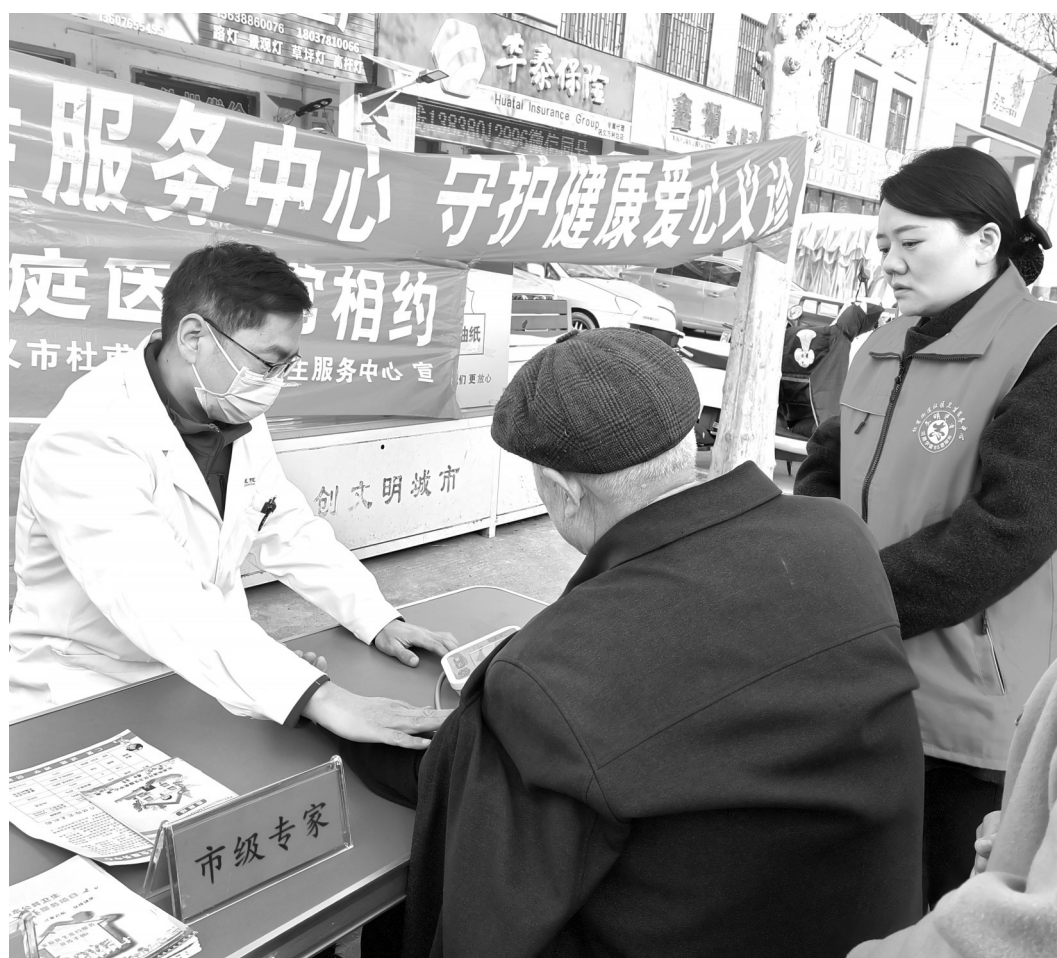
↑近日,在巩义市杜甫街道和美社区星河村小区门口,杜甫街道社区卫生服务中心医务人员为老年人提供健康检查服务。为推动老龄健康工作,该社区卫生服务中心组织家庭医生团队开展义诊活动。在现场,医务人员为居民提供身体检查、慢性病知识宣讲等服务,认真讲解家庭医生签约服务内容、履约保障及就医便利政策,引导居民主动签约、持续履约,让更多人享受到便捷、连续的基层医疗卫生服务。

在互动环节,专家现场解答了家长们的疑问。家长们普遍反映收获颇丰。此次联合开展需求调研,根据家长关注的热点确定讲座大纲,凝聚了协同育人的共识。