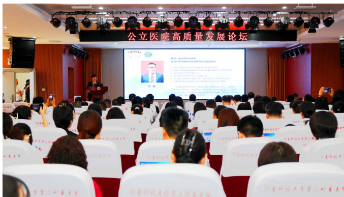
承办洛阳市公立医院高质量发展论坛系列培训活动