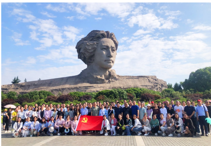
传承红色基因 汲取奋进力量