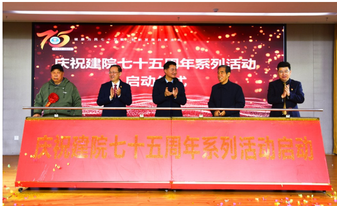
建院75周年系列活动

积极开展学术培训会议及系列论坛组织工作 河科大二附院承办河南科技大学第六届纪念“5·12”国际护士节系列活动暨护理高质量发展论坛,承办2次洛阳市公立医院高质量发展论坛系列活动;举办洛阳市高血压病规范化防治能力提升项目暨高血压病例大赛、豫西南区域县市高血压病防治中心工作会议暨血压测量培训会、洛阳市首届头痛论坛暨慢性偏头痛肉毒素治疗研讨班等15场学术交流会议。河科大二附院在承担社会责任的同时,进一步扩大了影响力。