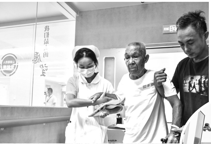
帮助患者进行康复治疗