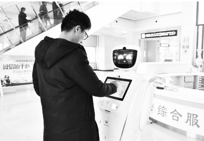
和导诊机器人“小镇”对话

下一步，镇平县人民医院将继续围绕群众就医的痛点和难点，创新工作思路，细化工作措施，整体提升医疗服务的舒适度、人性化、智慧化、数字化水平，形成“流程更加科学、模式更加延续、服务更加高效、环境更加舒适”的医疗服务模式，以信息化、智能化为着力点，推行“互联网+医院”模式，解决患者的急难愁盼问题，进一步增强患者就医安全感、获得感、幸福感，奋力谱写医院高质量发展新篇章。