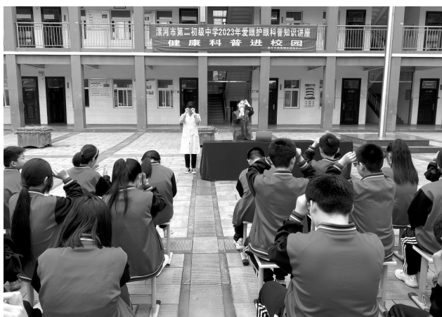
↑6月5日,在漯河市一所学校,漯河市疾病预防控制中心工作人员教学生做眼保健操。6月2日-5日,漯河市疾病预防控制中心科普宣传工作组分别到市区4所学校开展健康科普讲座进校园活动,促进中小学生学习健康成长和全面发展,增强爱眼护眼意识,养成良好的爱眼护眼习惯。