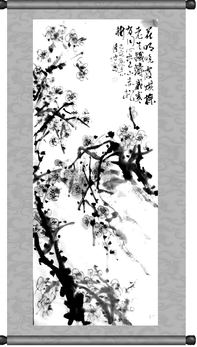
赵清波/作 (作者为泌阳县人民医院宣 传科科长、泌阳县书法家协会主席)