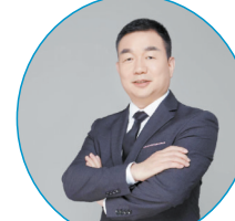
高峰杰 院长 登封市人民政府