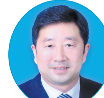
部炎辉 党委副书记、院长 巩义市人民政府