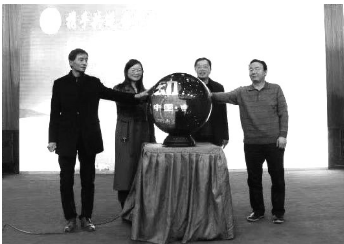
南阳眼科联盟成立