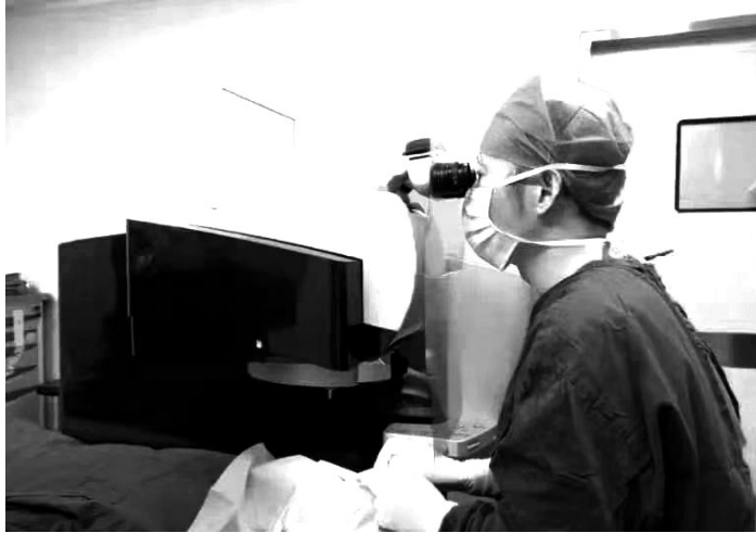
飞秒激光近视手术