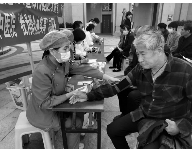
10月13日上午,荣阳市中医院组织十几名医务人员到天悦湾社区10号院开展“关爱老人健康”爱心义诊活动,并讲解常见病防治知识、急救知识等,发放了健康知识宣传资料,受到居民的好评。

当天,郑县中医院党委还为每一位老同志送去了“艾久宝”保健小器材和“九九重阳”健康体检大礼包,希望老人们拥有健康的身体和幸福的晚年。(杜如红 宁健鹏)