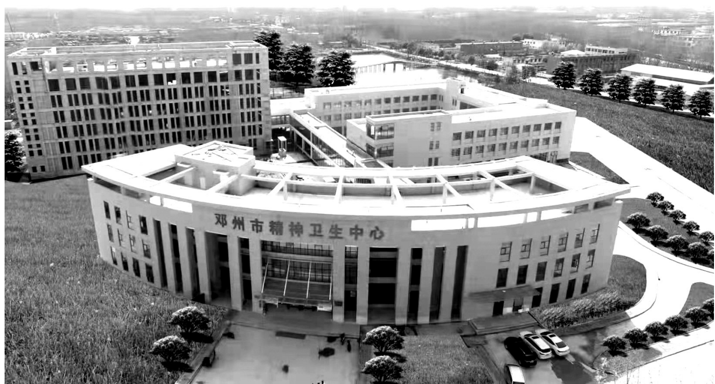
邓州市第三人民医院(邓州市结核病防治所、邓州市精神卫生中心)