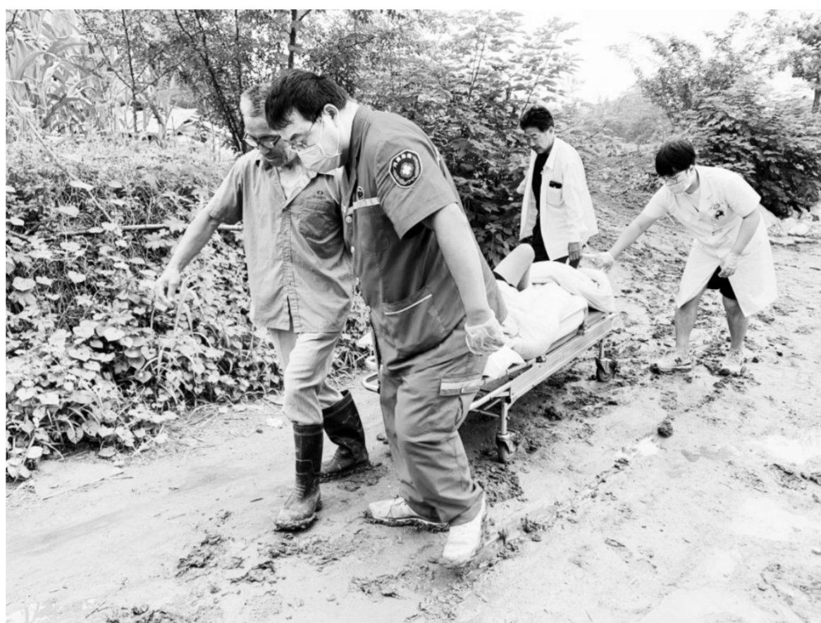
“泥巴裹着裤腿,汗水湿透衣背,我不知道你是谁,可我知道你为了谁……”不久前,在雨后的孟津县一乡村,孟津县中医院急诊科医务人员在泥泞的道路上抬着平板车运送患者,泥巴、汗水交织在一起,让群众深受感动,现场一位中学生不由自主地哼唱起《为了谁》这首歌。