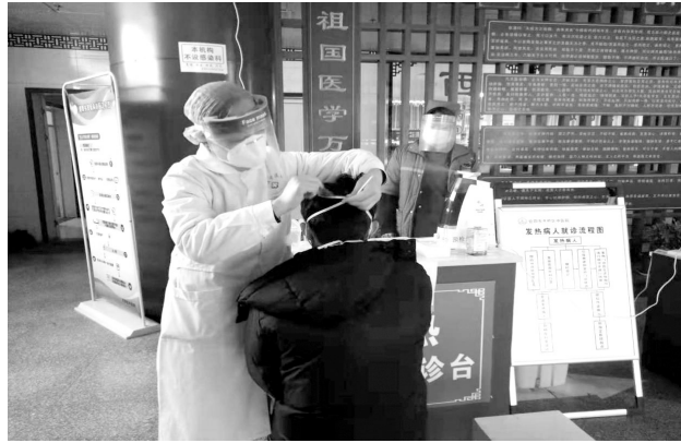
为来院就诊患者戴口罩