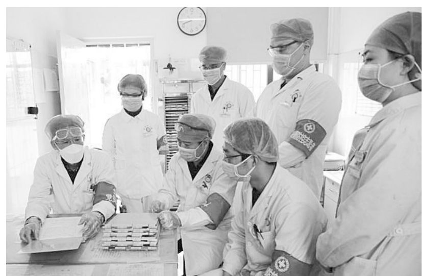
特殊病区里的特殊团队

近日，武汉市精神卫生中心院内发生感染，约80名医患被确诊新冠肺炎的消息令人痛心。防控疫情，防患于未然至关重要。作为精神病学专科医院，郑州市第八人民医院（郑州市精神卫生中心）于2月初快速设立了急重症