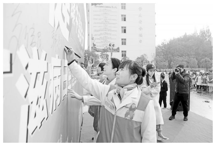
12月1日上午,漯河医专第二附属医院、漯河市第三人民医院等单位的医务人员和青年志愿者,到漯河职业技术学院参加2019年世界艾滋病日主题宣传活动,向大学生宣传艾滋病防治知识。图为医务人员和青年志愿者在艾滋病防治宣传背景墙上签名。