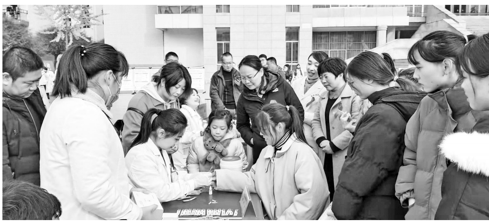
12月1日,漯河市郾城区卫生健康委员会组织辖区内10个医疗单位到漯河市职业技术学院参加全市艾滋病防治宣传活动。在活动现场,郾城区各医疗单位工作人员发放了干预包、安全套、宣传纸抽、毛巾及生活小礼品,引导青年学生正确认识艾滋病,认识到检测是知晓感染艾滋病病毒的唯一途径;要做到早检测、早发现、早治疗。