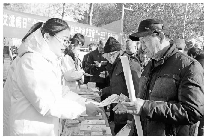
连日来,商丘市睢阳区卫生健康委员会组织区疾病预防控制中心、区直医院广泛开展艾滋病防治宣传活动,引导全社会积极参与“艾滋病检测月”和“性病防治宣传周”系列活动,倡导公众增强个人健康意识,正确认识艾滋病。