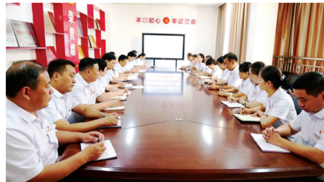
医院召开主题教育学习研讨会