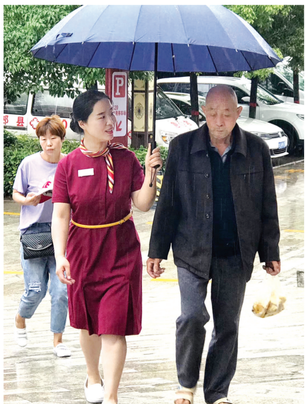
客户服务部职工为患者撑伞