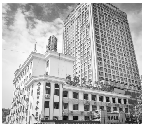
南阳市骨科医院大楼

雄厚的技术实力、一流的医疗服务,使南阳市骨科医院这样一家地市级专科医院先后被评为“依法治院先进单位”“河南省科技兴医先进单位”“河南省管理创新先进单位”等。南阳市骨科医院的职工用实际行动在全面建设小康社会的进程中奏响了“精医为民、昂首奋进”的最强音。