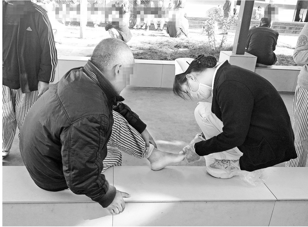
秋日暖阳下,孟津县小浪底镇精神卫生中心的护士正在细心地为患者剪脚指甲。洗手,洗头,洗脚,修剪指甲……日复一日,他们用自己的行动默默关爱着这些特殊的人群。

本报讯 (记者王明杰 通讯员吴向东)记者昨天从信阳市了解到,今年,新县全力推进全县农村户用厕所改造工作。目前,新县卫生健康委员会等牵头单位联合对17个乡镇(区、街道)62个行政村(居委会)的701户农村户用厕所改造完成情况进行实地核实。其中,达到改厕标准的有611户,未达到标准的有90户,改厕合格率为87.1%。 新县根据“户改厕”政策,按照改厕技术规范,建设示范点,以点带面,全面推进“户改厕”工作;同时,突出粪污治理这个重点,按照每个乡镇补助5万元的标准,支持建立管护体系(要有维修队伍、服务电话、抽粪车、管理制度),确保农村户用厕所改得好、管得好、用得好,切实提高群众的生活品质。截至目前,全县完成农村户用厕所改造7523户,超出省定目标任务140%。 新县各乡镇(区、街道)针对自查中发现的问题,举一反三,建立整改台账,逐户排查,逐户整改,确保已改厕质量合格;加强施工人员的培训和管理,确保新改一户,质量达标一户。该县还落实县直部门包乡镇工作制度,要求县农村工作领导小组办公室加强督查,督促县直部门加强对所包乡镇改厕的技术指导,帮助乡镇解决农村户用厕所改造中的技术难题,确保改厕工作按时按节点高标准推进。 新县积极争取农村户用厕所改造补助资金和整体推进村奖补资金,缓解乡镇资金投入压力。针对农村住户分散、农村户用厕所改造资金缺口较大等现状,新县不断创新工作方法,采用农户自己取土挖坑,将村内泥瓦工组成专业队,将以前配备的沼气吸渣车进行维修,作为吸粪车使用等,妥善解决工作中存在的难题。 目前,新县全力推进农村户用厕所改造工作,其中,核查“一体式”农村户用厕所改造模式330户,合格266户,合格率为80.6%;核查三格砖混农村户用厕所改造模式371户,合格345户,合格率为92.9%。