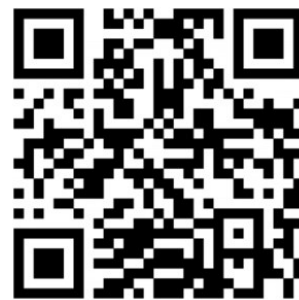
请扫描二维码了解详情