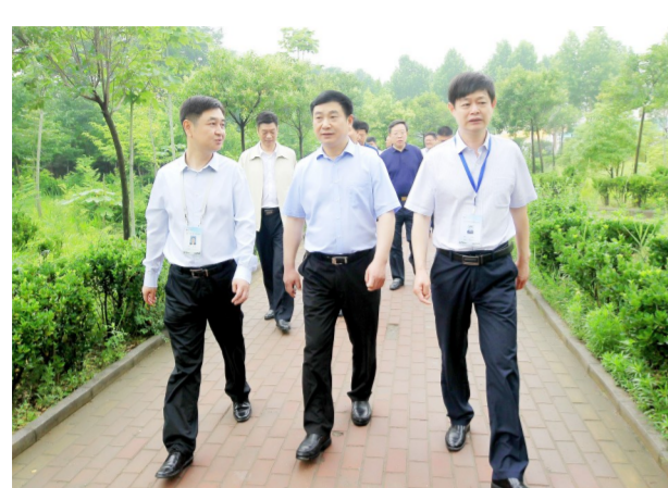
河南省卫生健康委主任蒯全程在校调研