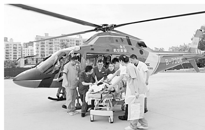
直升机转运患者现场