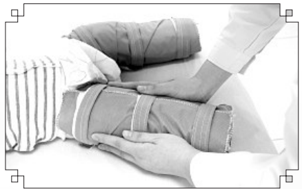
11. 加压、固定，保留20分钟