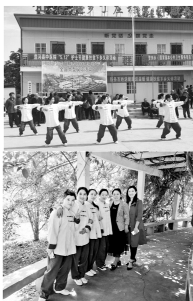
这个护士节过得有意义