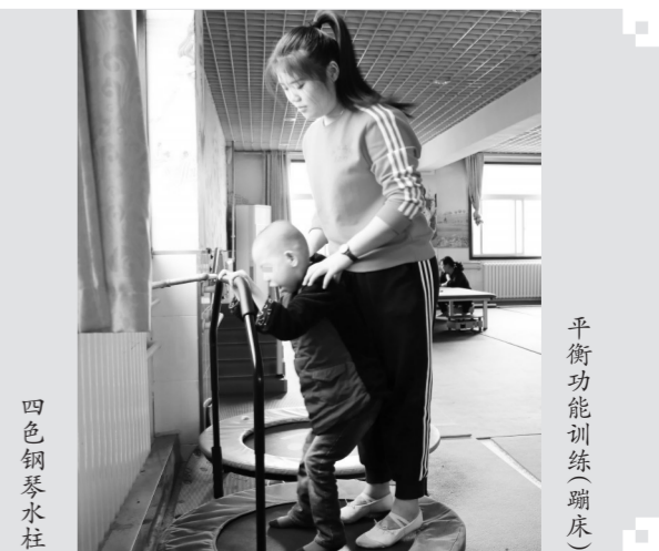
平衡功能训练（蹦床）