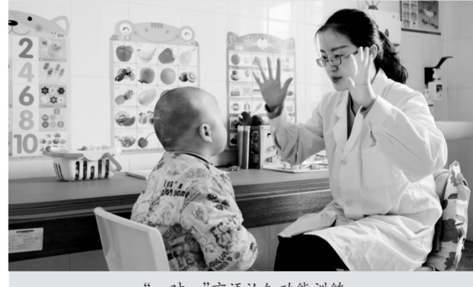
“一对一”言语认知功能训练