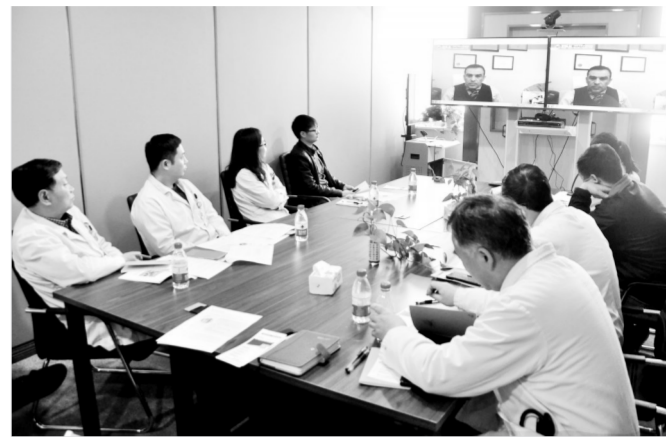
与美国梅奥专家远程会诊

据介绍，目前，在洛阳市中心医院，以神经内科为主导的脑卒中筛查多学科诊疗协作组、以急诊科为主导的急性心肌梗死开通冠状动脉协作组、以感染科为主导的肝肿瘤多学科诊疗协作组、以胃肠外科为主导的胃肠道肿瘤多学科诊疗协作组、以泌尿外科为主导的前列腺癌多学科诊疗协作组等，均取得了显著成效。