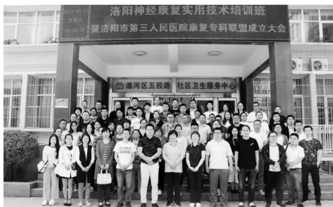
举办全市神经康复实用技术培训班，成立康复专科联盟。