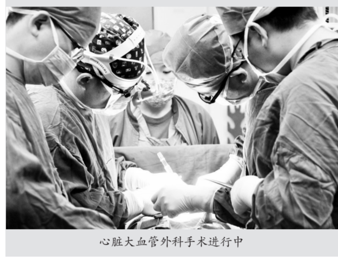
心脏大血管外科手术进行中