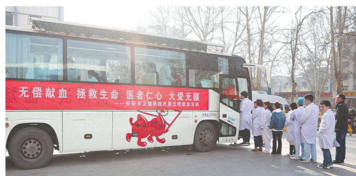
安阳市妇幼保健院医务人员无偿献血的情形