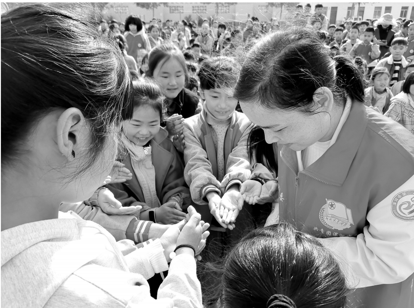
日前,漯河市第二人民医院的医务人员走进示范区召陵镇双语学校,围绕春季常见传染病的预防进行了重点讲解,受到了师生的好评。

郑州大学第一附属医院郑东院区门诊西药调剂室值班药师详细记下患者中毒相关信息和样品信息后,第一时间联系该院药物药效实验室(河南省精准医学临床质谱工程研究中心)。在得到肯定答复后,患者家人带上样本用最快速度送到了该实验室。