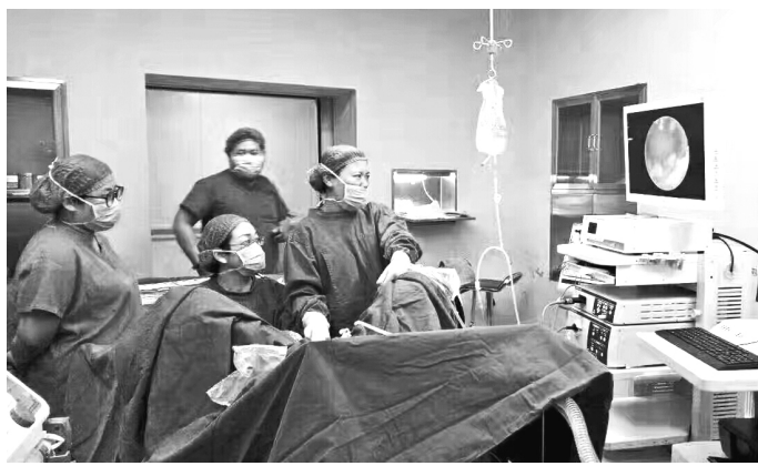
宁陵县人民医院妇科技术团队正在进行手术