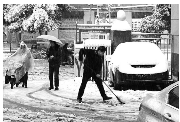
1月4日一早,西峡县人民医院在门诊大楼、病房楼前,尤其是坡道、台阶处放置防滑垫及警示牌,以防就诊患者滑倒摔伤;同时动员全院职工扫除积雪。

据了解,截至2017年农历年末,淮阳县将有380多名复转军人陆续回到家乡,他们均会享受到此项新政策。