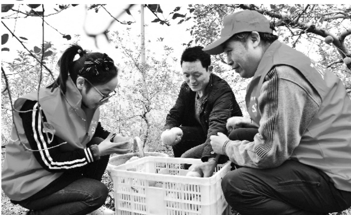
近日,灵宝市卫生计生部门组织50余名党员、志愿者,分成8个小组,在寺河乡上塔村果园为8户计划生育困难户采摘苹果,并帮助计划生育困难户销售1000余公斤苹果,受到了当地群众的称赞。