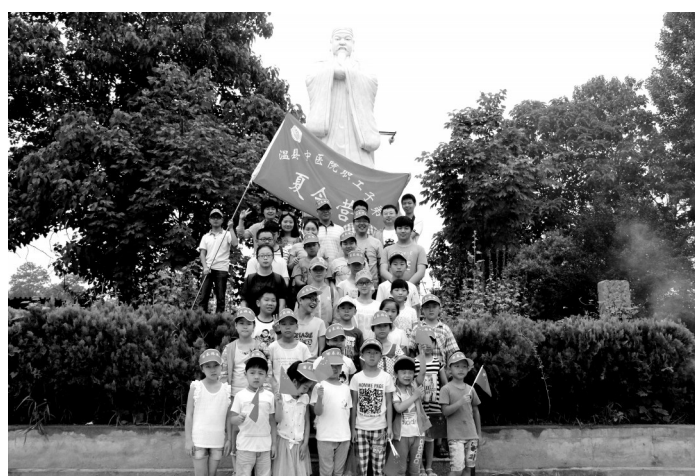
首届“温县中医院职工子弟杏林夏令营”活动