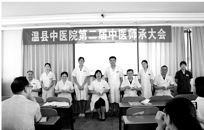
温县中医院第二届中医师承大会