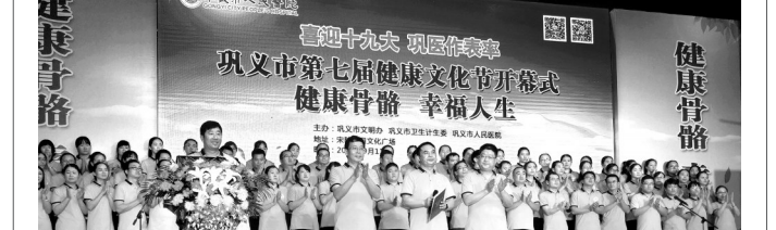
开幕式现场

据悉,自2011年以来,“巩义市健康文化节”已经成功举办6届。本届健康文化节从9月11日开始,将持续至9月17日,每天7时~9时,该院医疗、护理志愿者为群众进行多学科联合义诊,举办健康骨骼保健课堂,帮助群众正确认识骨科疾病,有效控制骨科并发症带来的危害。每天19时~20时,专家志愿者为大家举办健康知识讲座,并进行抽奖活动,鼓励群众积极参与,让群众学会用科学知识武装自己,养成健康生活方式。