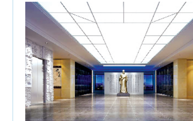
本版图片由相关单位提供