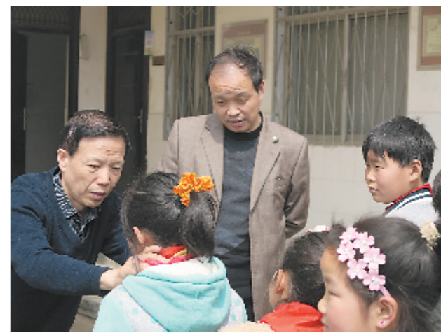
疾控专家在为小学生进行健康检查

郑州市疾病预防控制中心公布了2016年郑州市碘缺乏病病情监测结果:郑州市8~10岁儿童甲状腺肿大率、尿碘中位数、居民合格碘盐食用率3项指标均在国家消除碘缺乏病标准范围内。