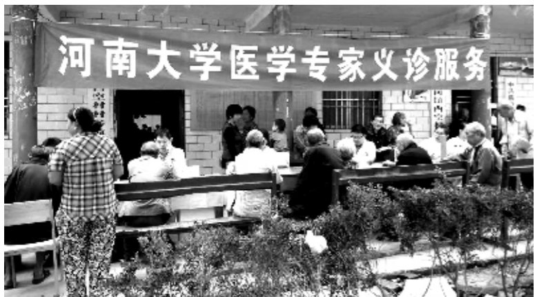
义诊和健康教育进社区

11月4日,在兰考县惠安街道办事处李寨村,河南大学淮河医院(淮河临床医学院)的专家团队如约来到这里为群众开展义诊服务。据了解,该院近两个月的时间与18个乡镇卫生院和养老机构进行了签约,多次组织专家到基层进行义诊、会诊及举办健康讲座等。