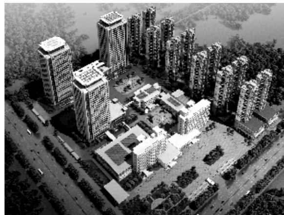
医院基本建设远景规划

近年来,濮阳市人民医院始终坚持“建人民满意医院、办百姓放心医院”的办院宗旨,秉持“诚信建院、质量立院、人才强院、管理兴院”的办院理念,把创建“健康促进示范医院”作为坚持公益性的重要载体,努力成为健康理念的倡导者、健康知识的传播者、健康促进的实践者、健康濮阳的示范者。