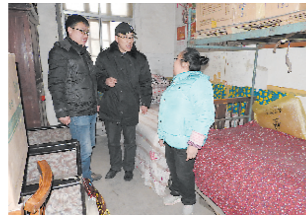
安阳县农合办工作人员到困难群众家中进行慰问