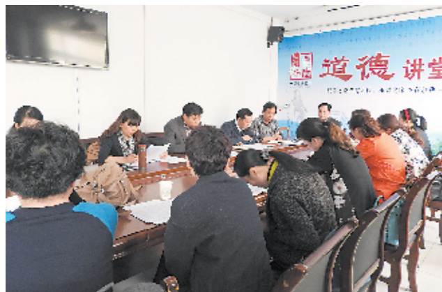
安阳县农合办邀请市级定点医疗机构有关人员召开新农合基金运行分析暨总额预付座谈会