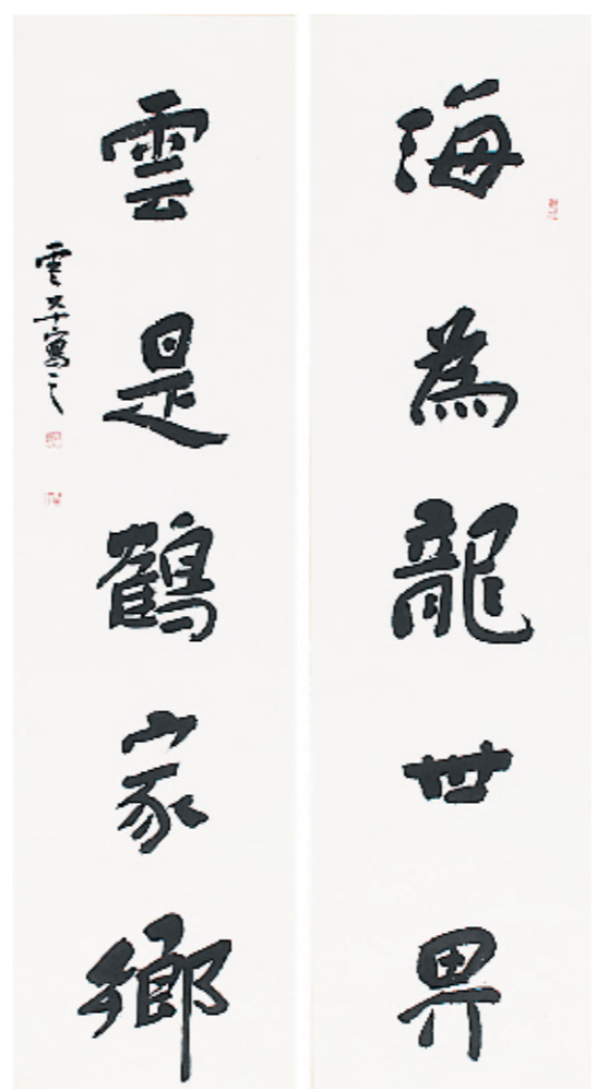
云平 中国书法家协会理事,省书家协会驻会副主席