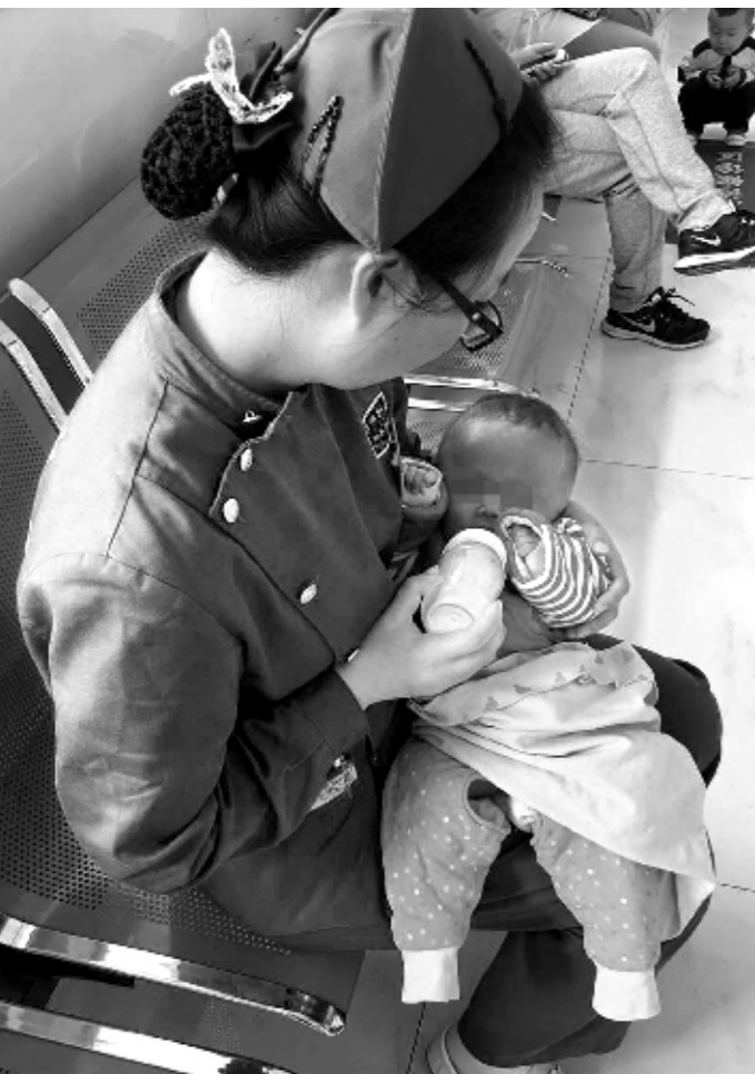
10月1日上午,郑州市第一人民医院急救人员接回一名女性外伤患者。患者7个月大的宝宝饿得哭闹不止,该院护士立即为宝宝喂奶,当起了“临时妈妈”。