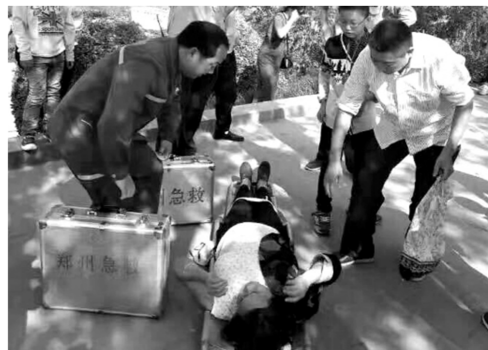
10月3日下午,一位老人在郑州市黄河风景名胜名区昏厥,郑州市紧急医疗救援中心特勤科工作人员立即对患者进行了抢救。