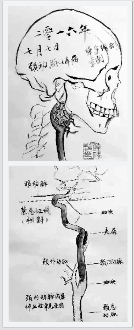
眼动脉 禁忌证据(相对) 颈外动脉 颈内动脉 颈内动脉闭塞伴血栓形成原因 颈总动脉