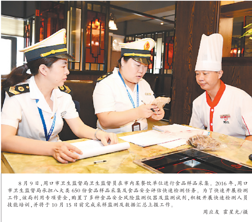
8月9日,周口市卫生监督局卫生监督员在市内某餐饮单位进行食品样品采集。2016年,周口市卫生监督局承担八大类650份食品样品采集及食品安全风险评估快速检测任务。为了快速开展检测工作,该局利用专项资金,购置了多种食品安全风险监测仪器及监测试剂,积极开展快速检测人员技能培训,并将于10月15日前完成采样监测及数据汇总上报工作。