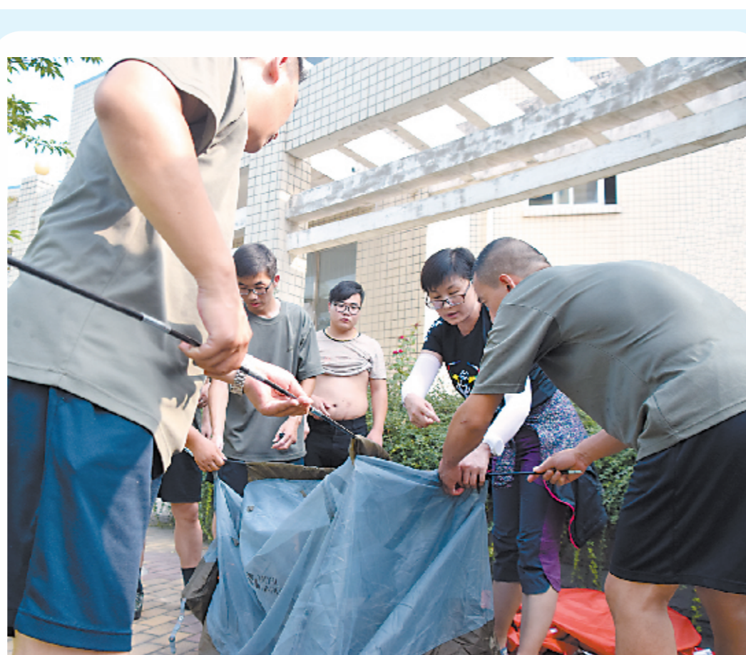
8月24日，焦作市疾病预防控制中心工作人员在跟随专业老师学习快速搭建帐篷的技巧，以便在突发情况下能够快速开展疾病防控工作。

目前，农业部已将布病列为八大重大动物疫病之一；同时，布病也是乙类传染病、重点地方病和职业病，常在一个地区和相关行业内流行传播。羊、牛饲养人员，羊、牛接生人员，牲畜屠宰人员和皮毛加工人员等，在与病羊、病牛的分娩物、排泄物、皮毛、血液接触后容易造成布病感染。因此，切断传播途径是防病的关键。