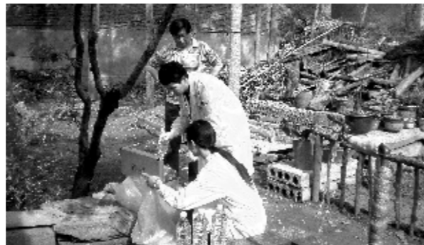
饮用水卫生监测采样