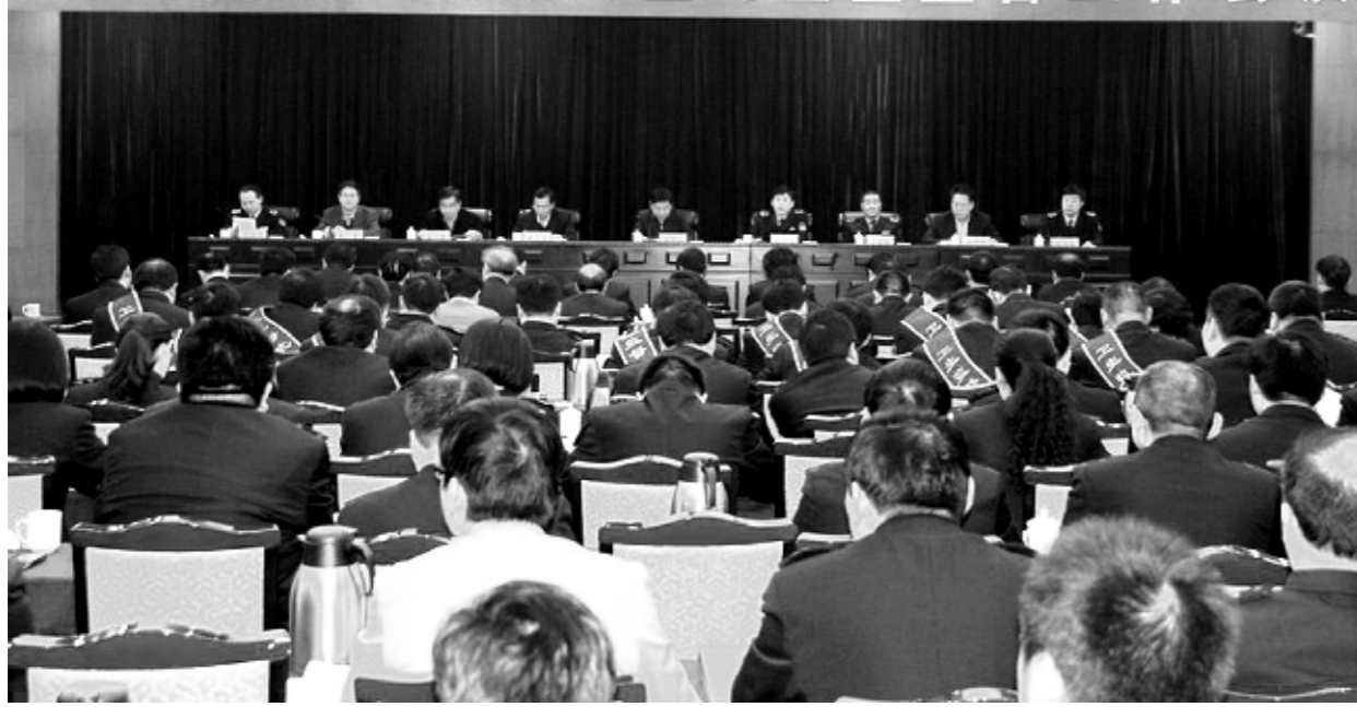
河南省食品安全与卫生监督工作会议现场

“十二五”期间，在河南省委、省政府和河南省卫生计生委的正确领导下，河南省疾病预防控制中心公共卫生研究所（以下简称省公卫所）围绕全省公共卫生发展方向和河南疾病防控工作实际，持续发挥政府主导、多部门配合、齐抓共管的工作机制，创新工作模式，提升管理水平，强化监测队伍建设及监测能力提升，出实招、办实事，圆满完成了国家下达的食品安全风险监测、居民营养与健康监测、生活饮用水卫生监测等工作任务。