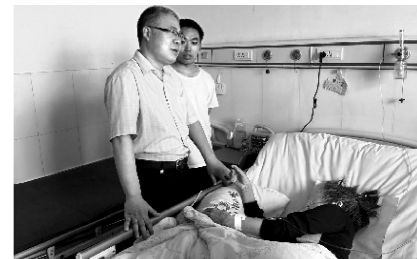
查询食物中毒原因