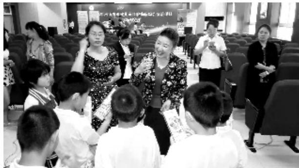
开展儿童口腔疾病防治项目