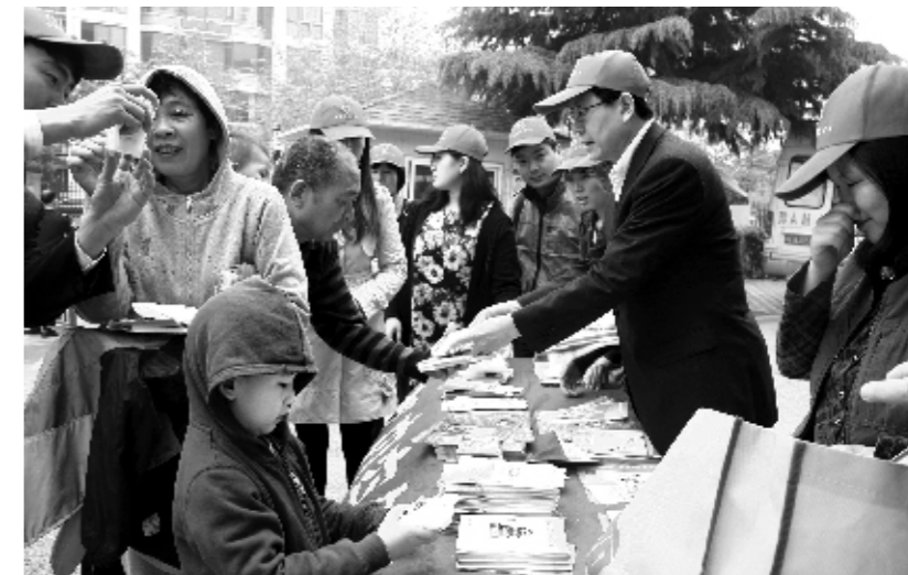
开展公共卫生知识宣教活动

在实施“农村义务教育学生营养改善计划”试点县，省公卫所积极进行学生营养健康状况监测、合理膳食指导等工作，监测学校数不少于本地区实施“农村义务教育学生营养改善计划”学校总数的10%。同时，省公卫所还按照《河南省城乡青少年健康危险行为监测方案》，努力做好城乡中学生健康危险因素监测工作。