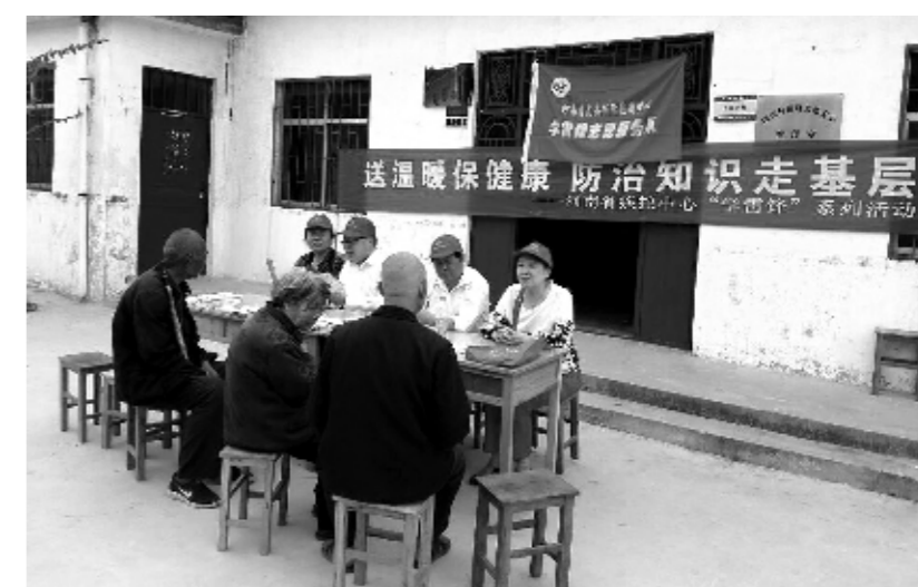
开展“学雷锋”系列活动