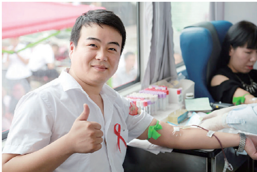
↑8月15日，爱心人士在滑县人民会堂广场进行无偿献血。此次献血活动由安阳市中心医院等单位精心筹划。当天，共有180人参加了无偿献血活动。

“中医药文化博大精深。不管平台大小，医生只要肯钻研，就能发挥中医药应有的效力，得到患者的认可。”曾伟说。