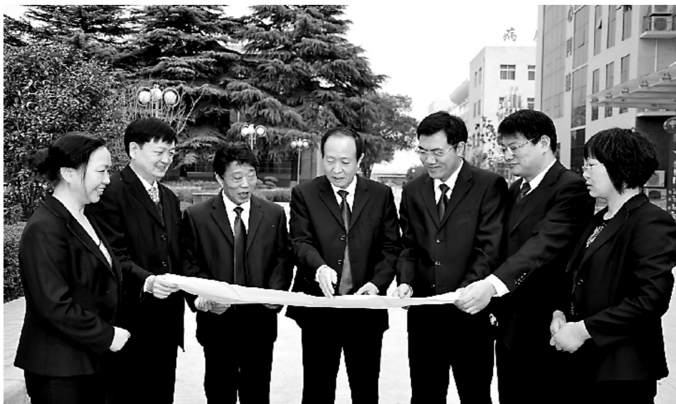
再开新路,再创新辉煌。

针对精神病患者的特殊情况,洛阳市精神卫生中心创造性地创建了“大病区、小社会、多功能、利康复”的医疗康复模式。在该模式中,医务人员既是医疗指导者,又是参与者,集药物治疗、心理治疗、行为矫正、功能康复为一体进行开放式、社会化组织管理,把病区作为社会单元对患者进行角色分工,根据患者的病情,从生活起居入手,有针对性地开展各种医疗康复活动。这种全新的、具有独特专科特色的医疗康复模式,不仅得到广大患者、家属及众多专家学者的充分肯定和肯定,而且成为国家“686项目”推广的社区康复模式的主