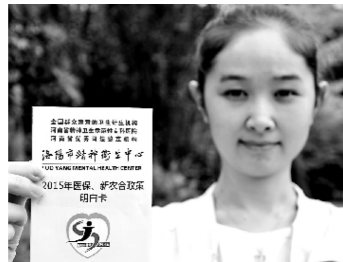
小小明白卡,让群众就医一目了然。