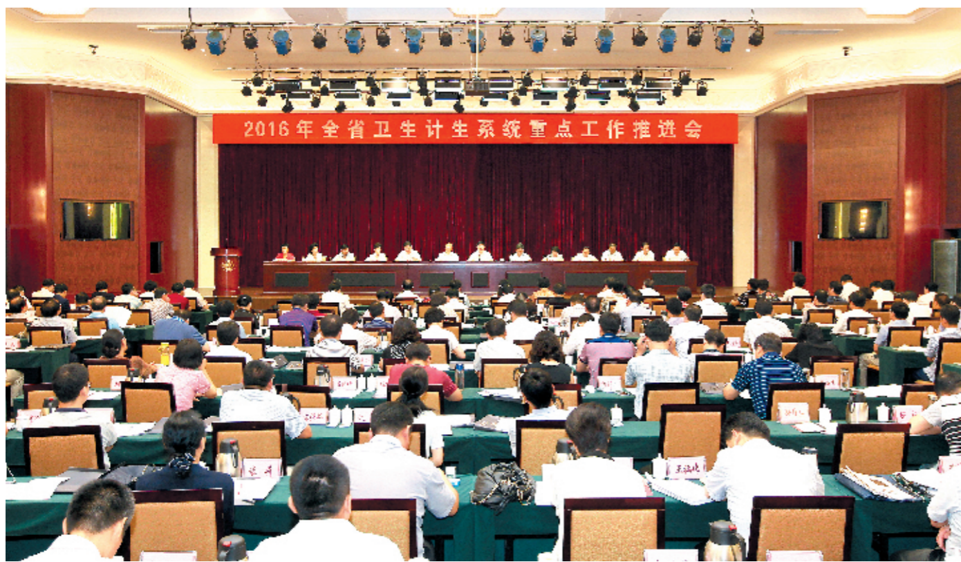
7月26日上午,2016年全省卫生计生重点工作推进会在郑州召开。