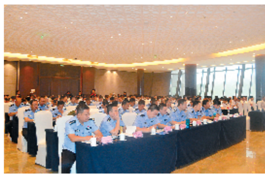
培训现场

本报讯 7月1日，全省卫生计生与公安部门执法工作培训会在济源召开。会议旨在进一步健全全省卫生计生行政执法与司法衔接机制，严厉打击非法行医、非法采供血、妨害传染病防治以及严重扰乱医疗服务秩序等涉及卫生计生领域的违法犯罪行为，维护正常的医疗服务秩序。18个省辖市和10个直管县的卫生计生行政部门、监督机构和公安部门治安支队、案件大队的主要负责人共200余人参加了此次培训。