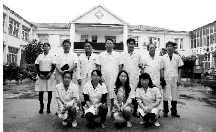
爱岗敬业的医疗团队