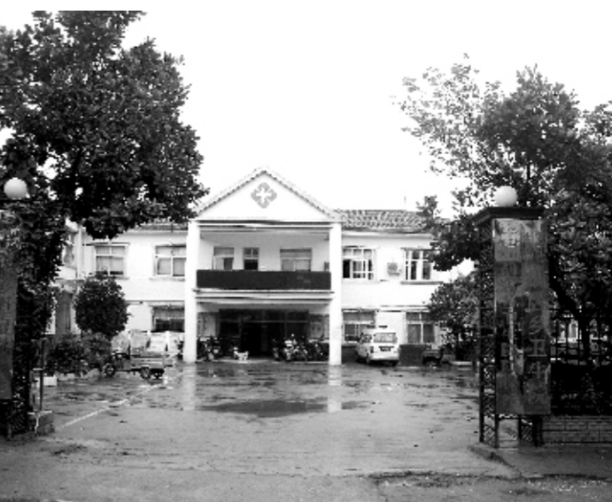
胡店乡卫生院外景

胡店乡卫生院强化乡村卫生服务一体化建设，对村卫生室实行“两签六统一”管理。“两签”即卫生院与乡村医生签订聘用合同、卫生院与村卫生室签订目