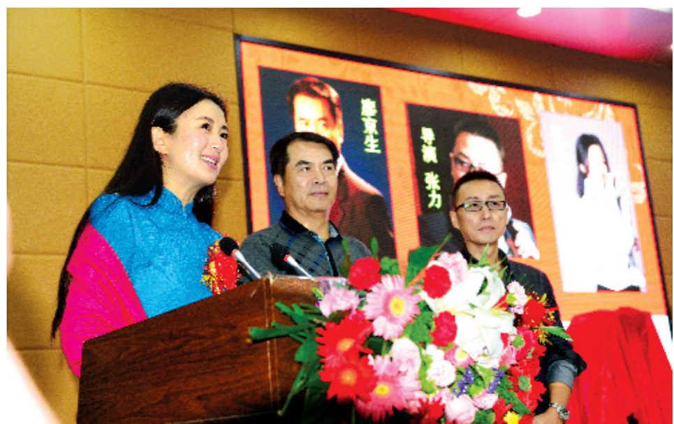
开机仪式现场

本报讯(记者刘永胜 莫涛涛)9月13日,洛阳市妇女儿童医疗保健中心迎来“一日双喜”——国内首部反映妇幼卫生工作的电影《生死拯救》在这里开机,该中心新院区也同时正式开诊。国家卫生计生委宣传司副司长姚宏文,省卫生计生委副主任曲杰,洛阳市副市长王敬林出席活动启动仪式。