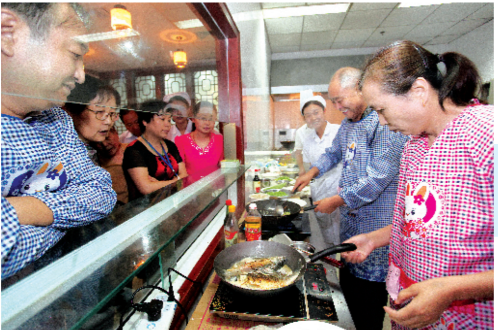
国内康复医学专家在郑州论剑,就康复医学发展等议题进行了交流。