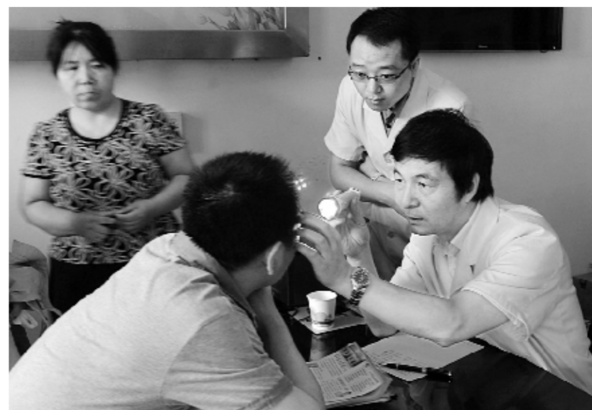
近日,安阳市眼科医院专家义诊团一行8人前往安阳市文峰区光华社区开展义诊帮扶活动。图为该院专家团队正在为一位社区居民检查眼病。