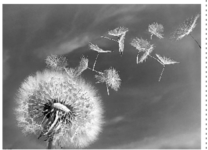
(本版图片为资料图片)

克,鸡血藤30克,黄柏20克,水煎,热敷癍肿癍斑处,每日1剂,分三四次热敷,一般1周左右明显好转。该方法可以用于外伤术后癍痕癍斑等。(梅松政)