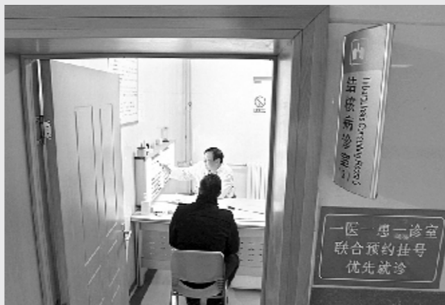
一位患者正在河南省传染病医院（郑州市第六人民医院）接受治疗。

有肺结核病史：如颈淋巴结结核、骨关节结核等，有原发结核过敏性增高症候群者，如结节性红斑、泡性结膜炎、关节风湿样疼痛等。