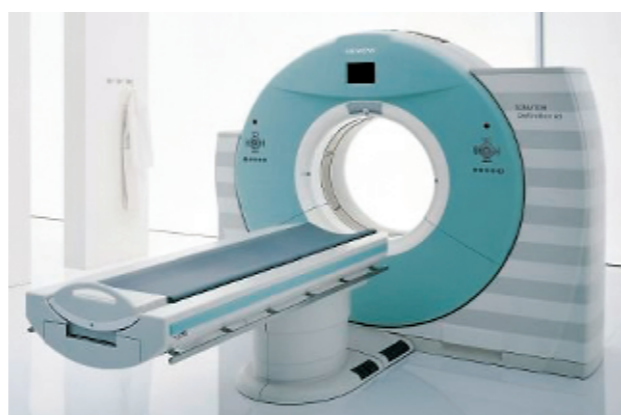
德国西门子高端64排128层螺旋CT