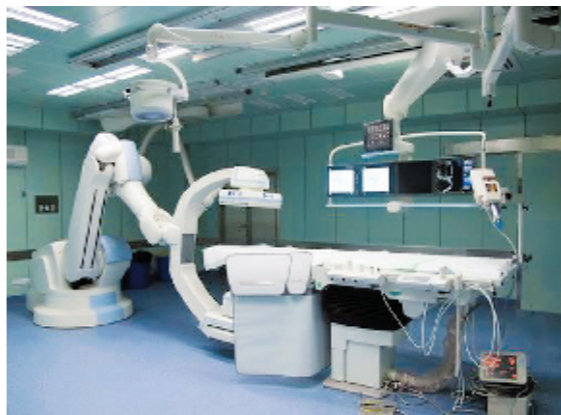
德国西门子移动式平板探测器血管造影系统