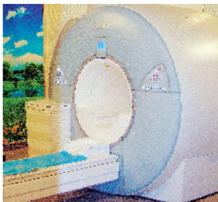
德国西门子Avanto1.5T磁共振